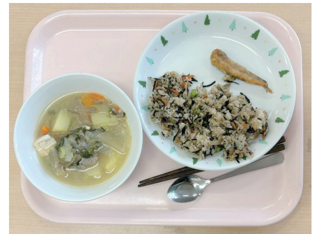
この日の献立は、ひじきごはんにニギスの磯辺揚げ、豚汁。「かみごたえ」を重視したメニューだったそうですが、B先生はほぼ丸呑み、2分で完食です